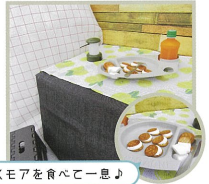
スモアを食べて一息♪