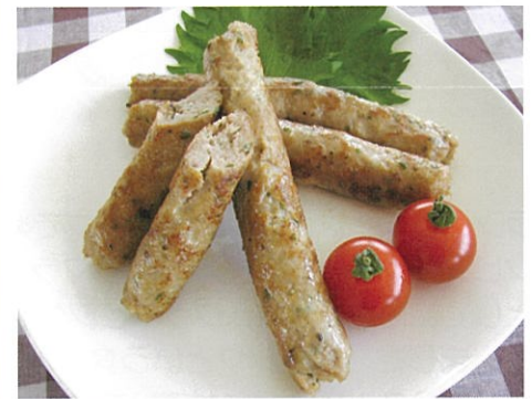
『手作りソーセージ』